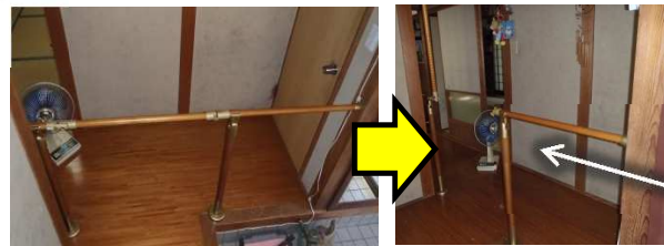
廊下は安定して行き来できるように開閉式の手摺を設置しました