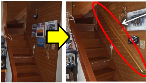
補強板に手すりを取付けました