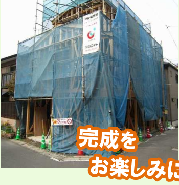
完成をお楽しみに