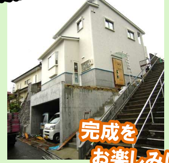
完成をお楽しみに