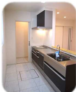
ダイニング、リビングを見渡す事ができる対面キッチン！奥には、食品庫兼用収納も確保