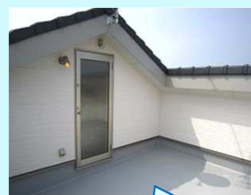
3階のバルコニーは約6畳あり、洗濯物もたくさん干す事ができ天気の良い日はバーベキューや夜空を見ながらの晩酌も楽しめる眺めの良いバルコニー