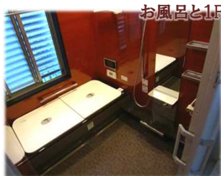
お風呂と1Fのトイレはシックにまとめました